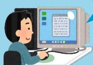
システムへログイン