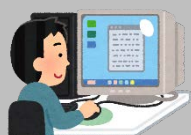
様式をダウンロード