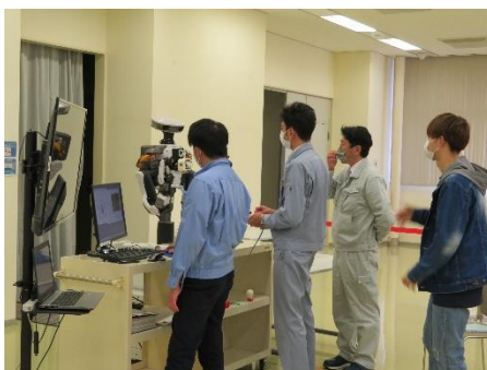
デモ・ロボットによるシュミレーション