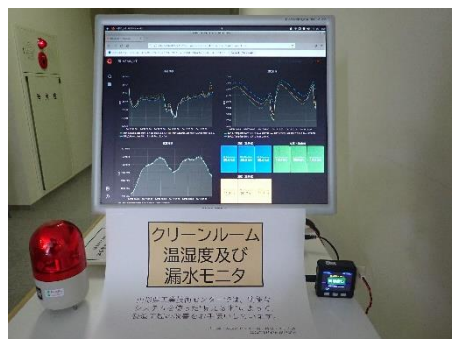
クリーンルーム管理システム